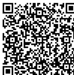
2015-2part2 2 級リスニング